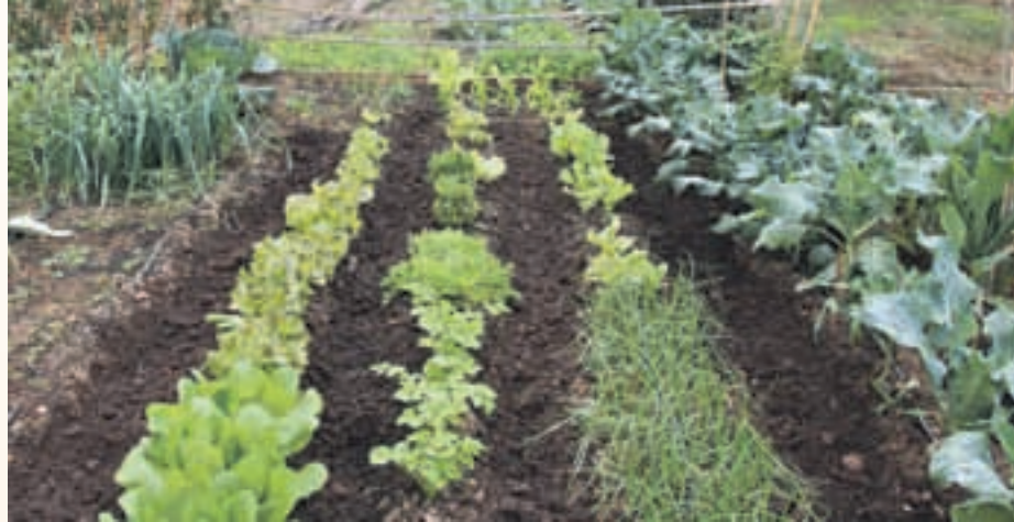
Els horts urbans es conreen seguint mètodes ecològics

Els horts s'adjudicaran de forma proporcional a tres trams d'edat: menors de 35 anys, persones d'entre 35 i 65 anys i majors de 65 anys. Malgrat tot, si algun tram no té prou sol·licituds els horts reservats a aquest segment de població es poden ocupar amb peticions dels altres grups d'edat.