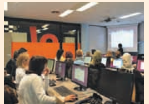
Els cursos volen arribar a tots els públics

AVANÇAT: A on es profunditza en les eines