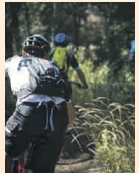
La cita reunió a amantes de la bicicleta

S ant Andreu de la Barca ha sido este mes de octubre el punto de referencia del sector de la bicicleta con la organización del certamen Sant Andreu Festival Solo Bici, que ha reunido a las principales marcas del sector que han presentado en exclusiva las novedades de la temporada.