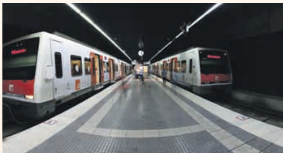
El preu del bitllet es reduirà gairebé la meitat

Actualmente, Sant Andreu de la Barca está en la segunda corona metropolitana y una tarjeta de 10 viajes, que es la más utilizada, para ir a Barcelona, por ejemplo, cuesta 20,10 euros. Con la incorporación en la zona 1 pasará a costar 10,20 euros.