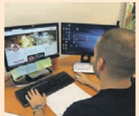
La iniciativa vol donar una oportunitat als joves

ric Llorca, ha explicat que aquesta línia d'actuació pretén contribuir a disminuir l'elevat percentatge de persones joves que estan en atur malgrat haver obtingut una titulació reglada o laboral que l'habilita per accedir al mercat laboral.