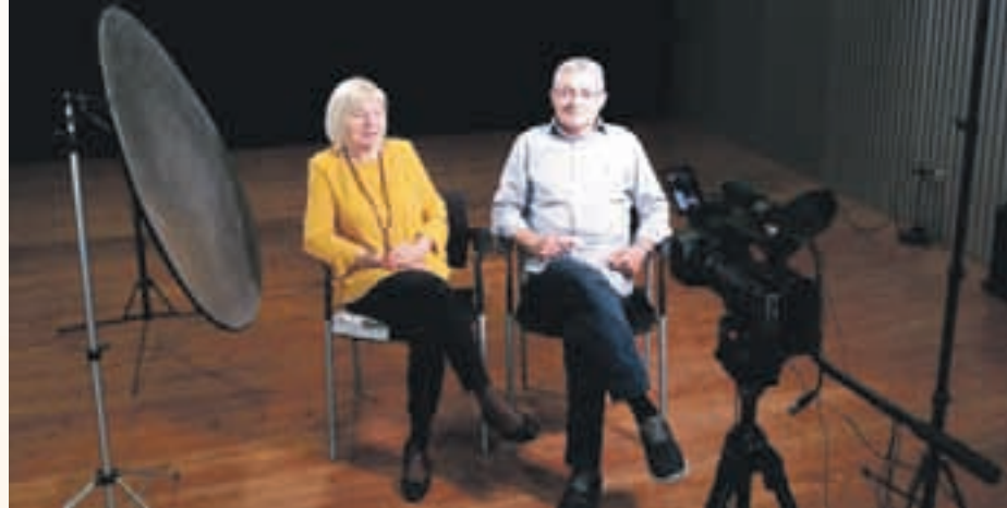
Momento de la grabación del documental

El proyecto se basa en las experiencias de las personas que dejaron su tierra natal y llegaron a Sant Andreu entre los años