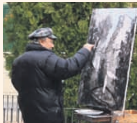
El concurso de pintura rápida es un clásico de la Fiesta de Sant Andreu

De entre las actividades previstas destaca