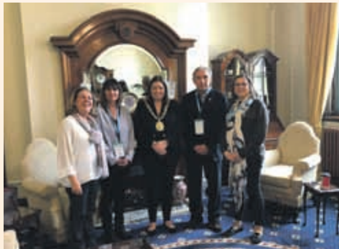
La representación municipal se reunió con la alcaldesa de Belfast

Algunas de las principales preocupaciones son la calidad del aire, la inclusión, la desigualdad y la sostenibilidad a largo plazo de determinados centros urbanos, donde la amenaza que supone el cambio climático crece año tras año.