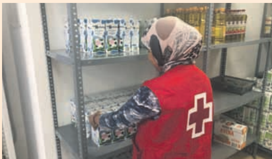
Los voluntarios de Cruz Roja colaboran en el Banco de Alimentos

Arroyo comenta que "hay muchas personas que se dirigen a la entidad para colaborar pero el hecho de tener que desplazarse a Martorell es un factor que dificulta que se involucren". El objetivo ahora es conseguir el mayor número de voluntarios posible para poner en marcha proyectos y cursos de formación, como por ejemplo los que organiza la entidad de primeros auxilios. Aunque ha sido recientemente