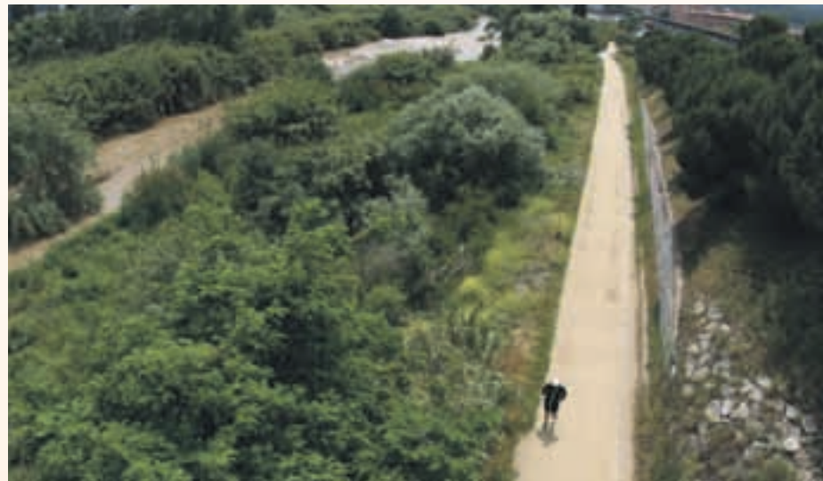
La ladera del río se convertirá en un espacio de ocio para los ciudadanos

Como tal, Sant Andreu de la Barca forma parte de la Red Europea de Ciudades Saludables (RECS), de la que, en Catalunya, solo participan también Barcelona y L'Hospitalet de Llobregat. Ahora el Ayuntamiento lidera un proyecto pionero en Catalunya: se trata de estudiar, cuantificar y saber el impacto positivo que tiene para la salud de las