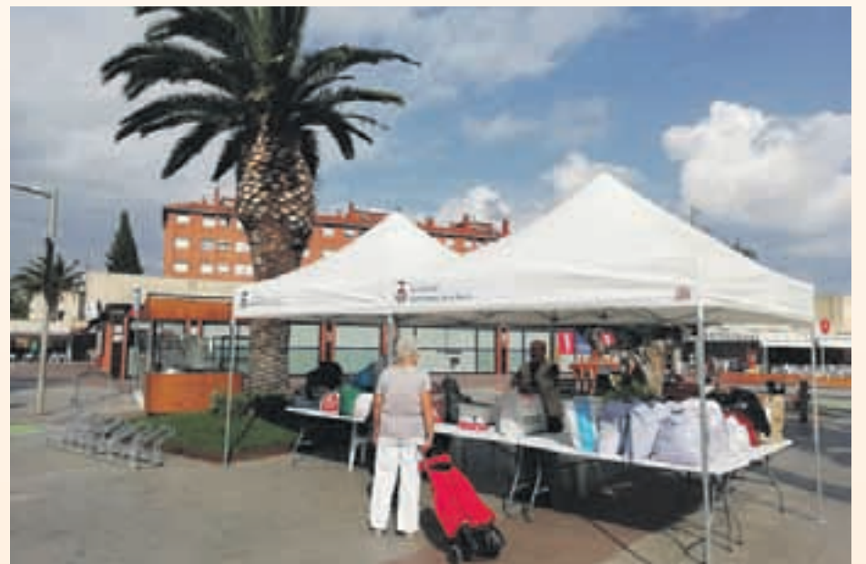
Els voluntaris del Fòrum Solidari van participar a la iniciativa