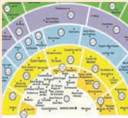
Mapa tarifario del área de Barcelona

Badia del Vallès, Barberà del Vallès, Begues, Castellbisbal, Cerdanyola del Vallès, Cervelló, Corbera del Llobregat, Molins de Rei, Palnejà, La Palma de Cervelló, El Papiol, Ripollet, Sant Andreu de la Barca, Sant Climent de Llobregat, Sant Cugat del Vallès, Sant Vicenç dels Horts, Santa Coloma de Cervelló y Torrelles de Llobregat.