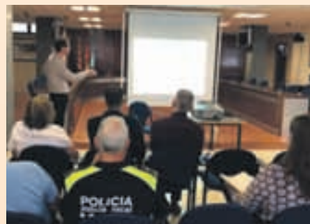
Momento de la reunión para sentar las bases de cómo mejorar el entorno

El consistorio ha organizado este mes un encuentro con representantes de la Agencia de Ecología Urbana de Barcelona, la Diputación, la Generalitat y el Área Metropolitana de Barcelona (AMB) para poner sobre la mesa la propuesta de Pla de acció para la mejora de la calidad del aire, que ha redactado la Agencia de