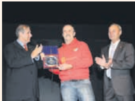
Millor entitat: Club d'Hoquei