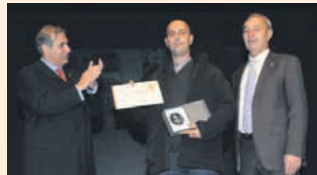
A la campanya Cap Nen sense Joguina del CF Sant Andreu de la Barca