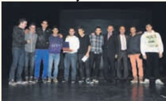
Millor equip: Cadet del Futbol Sala