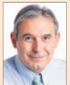
M. Enric Llorca i Ibáñez Alcalde de Sant Andreu de la Barca

En definitiva, desde el Ayuntamiento vamos a seguir trabajando contra el paro e innovando con nuevas medidas que permitan que nuestros vecinos y vecinas puedan encontrar empleo.