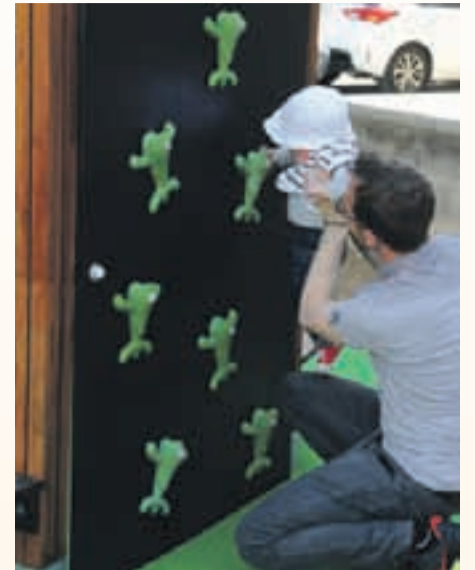
y zonas infantiles de calidad en su tejido urbano.