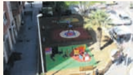
Rodoreda i Rubén Darío. Sant Andreu cuenta ya con más parques