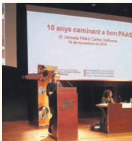
La iniciativa va premiar, ara fa 2 anys, el programa de l'Ajuntament de Sant Andreu

El PAAS és la resposta de salut pública per prevenir i controlar l'epidèmia d'obesitat que estan vivint els països industrialitzats i que és la base de molts dels problemes de salut crònics. L'enfocament del PAAS és integral i treballa, per un costat, la capacitat de les persones per prendre decisions informades sobre el seu estil de vida i la seva salut i, per l'altre, el desenvolupament d'entorns generadors de salut.