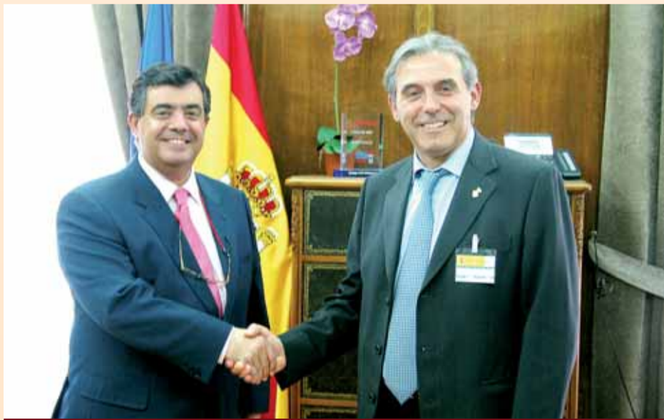
Enric Llorca con el presidente de la Agencia Española de seguridad alimentaria y nutrición Roberto Sabrido

Por último, las propuestas no se quedan aquí y habrá muchas más novedades en los próximos meses.