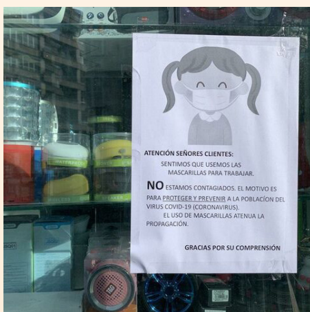
Carteles informan de las nuevas reglas

El Ayuntamiento, que mantiene contacto permanente con el tejido económico local, también presta apoyo colectivamente a la tramitación de ayudas de otras administraciones.