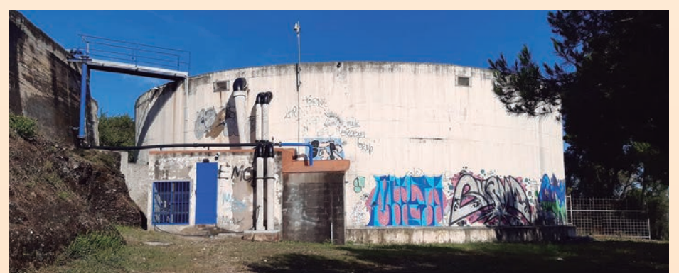
El nuevo depósito ampliará la capacidad del actual

Los dos depósitos estarán conectados entre sí y servirán para alcanzar de agua la población en caso de necesidad.