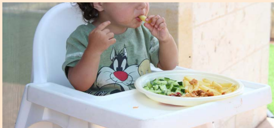
L'Ajuntament completarà les beques de menjador