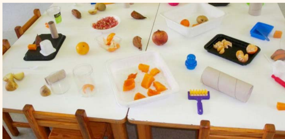
L'Ajuntament ofereix 139 places d'escola bressol

Amb la finalitat de facilitar la conciliació familiar i laboral durant l'estiu, l'Ajuntament mantindrà operatiu durant el mes de juliol el servei. Moltes famílies han vist trastocats els seus plans com a conseqüència de la pandèmia i els progenitors de molts infants es veuran obligats a treballar durant l'estiu, com ara els que formen part dels serveis sanitaris. Donades aquestes circumstàncies,