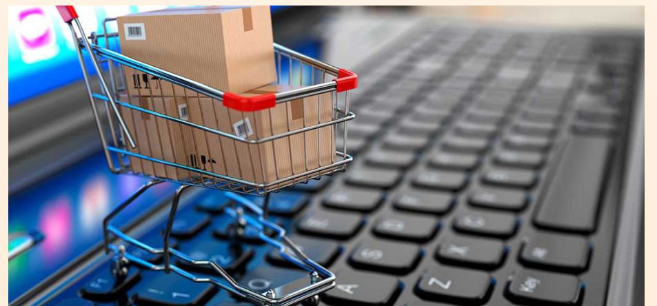
El comerç on line ha arribat a les nostres vides per quedar-s'hi

A la venda on line és fonamental la imatge del producte i la seva descripció. L'Ajuntament pagarà les fotografies dels 100 primers productes que cada botiga faci de la seva oferta per pujar a la plataforma. També finançarà amb fins a 2.000 euros per comerç, uns diners que serviran per pagar les despeses en concepte de comissió de la plataforma.