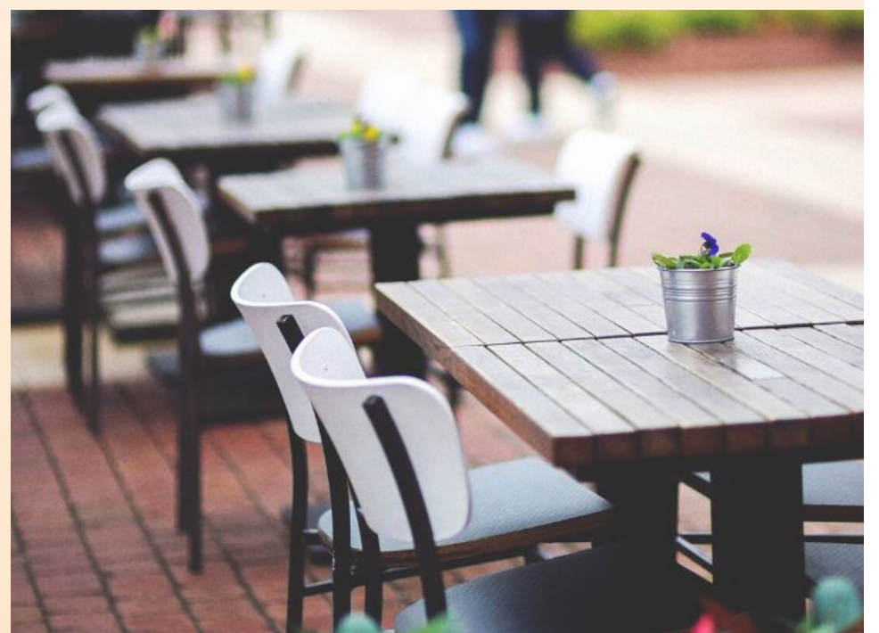
Els bars s'han hagut d'adaptar a les noves circumstàncies

A més, el consistori ha repartit kits de seguretat entre els comerciants que han reprès la seva activitat, que incorpora mascaretes, gel hidroalcohòlic, pantalles facials i guants.