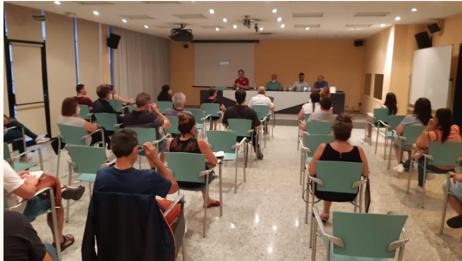
Acte de presentació de la iniciativa als comerciants

La iniciativa preveu l'impuls de la digitalització del comerç local i proposa una eina de venda on line als comerciants per facilitar la seva presència a internet i la venda mitjançant Internet dels seus productes o bé dels seus serveis. D'aquesta manera, el comerç