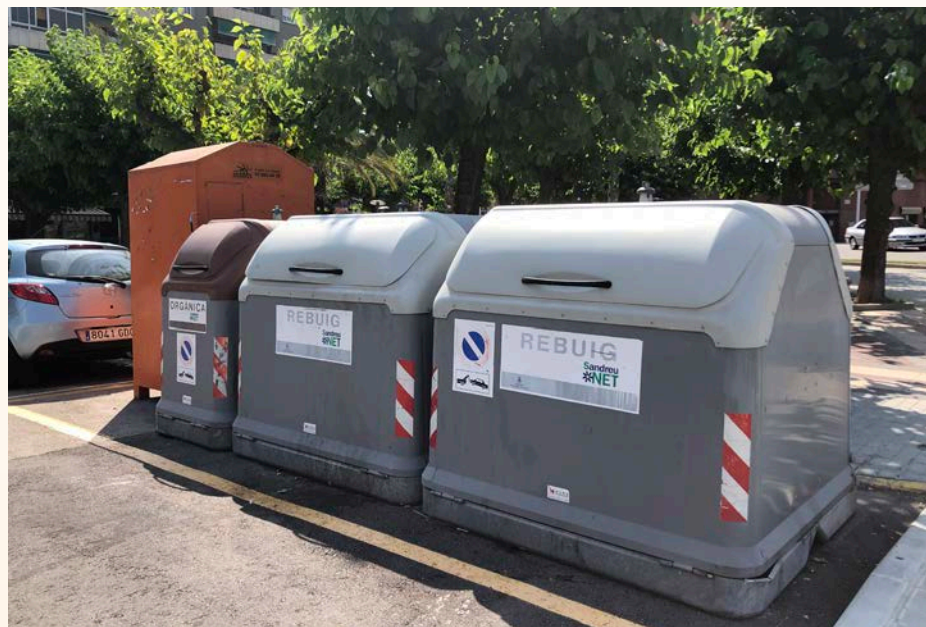
Cada vecino de Sant Andreu genera 1,18 kilos de residuos al día

La prevención de residuos en peso, volumen, diversidad y peligrosidad es uno de los principales retos para conseguir una gestión sostenible de los residuos municipales y, al mismo tiempo, es el camino para poder cumplir con los objetivos establecidos en la normativa sectorial. Involucrar a los ciudadanos, agentes económicos y entidades de la ciudad para que adquieran nuevos hábitos, valores y actitudes de consumo es