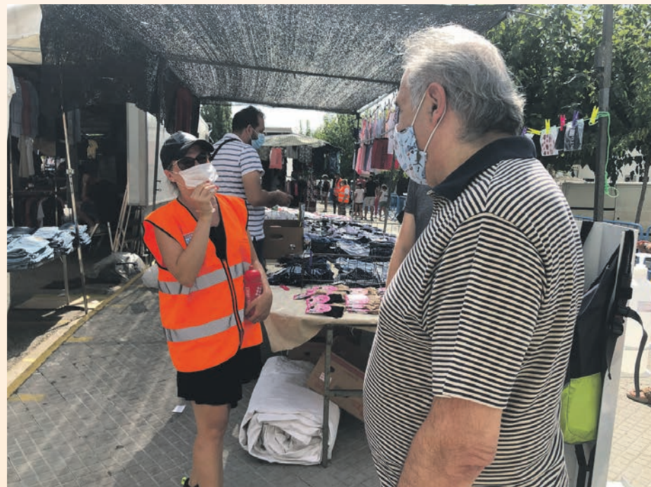
Los agentes cívicos recuerdan las normas a los ciudadanos

con el objetivo de reforzar la supervisión y atención ante el rebrote de coronavirus que sufre el área metropolitana, y complementa las tareas de inspección que llevan a cabo los agentes de la policía local.