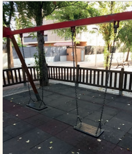
La colaboración ciudadana ayuda a detectar desperfectos

De esta manera, durante el mes de agosto se han arreglado columpios,