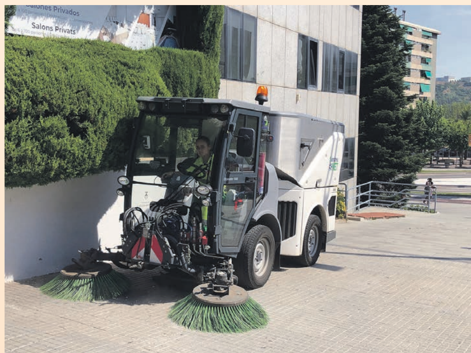
La barredora hace pasadas regulares por las calles de la ciudad