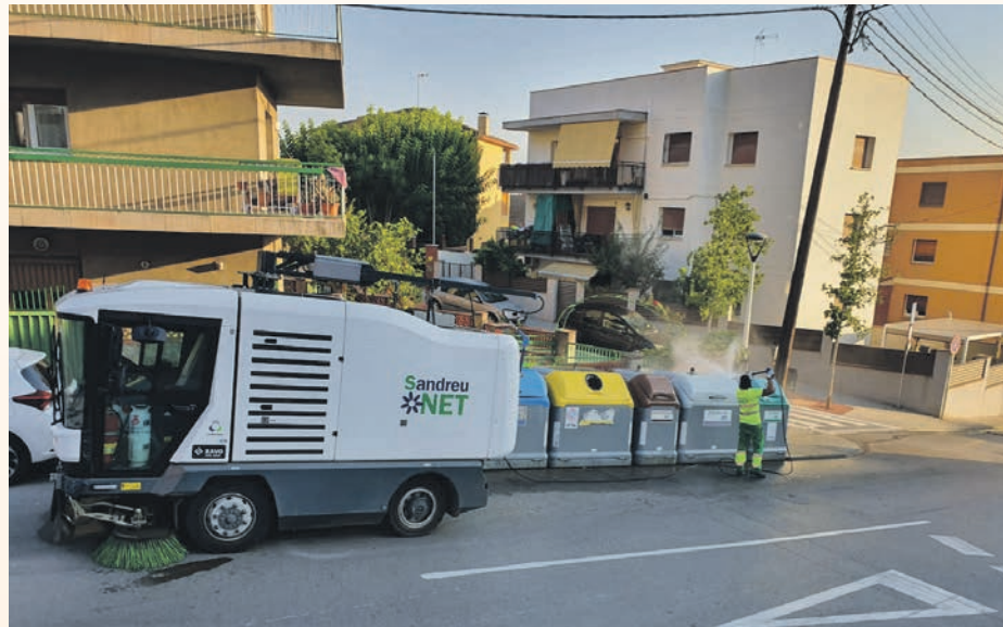
Los contenedores se limpian y desinfectan de manera periódica