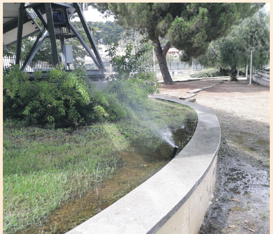
La ayuda ciudadana ha permitido detectar fallos en el sistema de riego