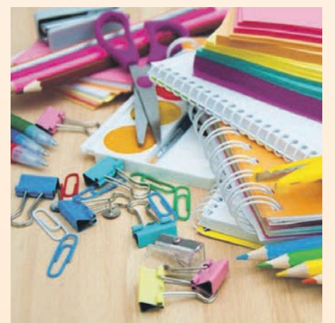
El Ayuntamiento ayuda en el pago del material escolar

Este mes se ha incrementado la bolsa de pisos destinados a alquiler social y que están reservados para familias vulnerables. En este caso el Ayuntamiento alquila los pisos a particulares de la ciudad, les garantiza el cobro de la renta y el mantenimiento de la vivienda, y los alquila a un precio social a familias con necesidades especiales. En este caso, se han alquilado dos nuevas viviendas, que ya se han adjudicado a dos familias, y el consistorio continúa trabajando para dar respuesta a las necesidades de la ciudad. El servicio de atención a las mujeres municipal continúa trabajando para prevenir y atender situaciones de violencia machista, que se pueden incrementar a raíz de la pandemia. Durante el verano el Ayuntamiento ha dado acogida a tres mujeres que vivían esta situación.