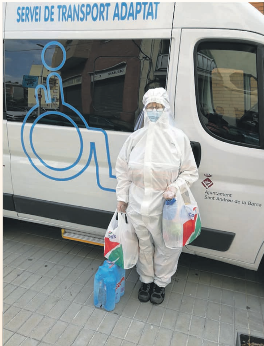
El Ayuntamiento lleva compra a domicilio de las personas confinadas

Garantizar la alimentación es otro de los objetivos fundamentales durante este período. El Banco de Alimentos ha continuado funcionando durante el verano, periodo durante el cual se han tramitado ayudas para 15 nuevas familias, que incluye servicio de comida para recoger, compras en supermercados y el propio Banco de Alimentos. El próximo 14 de septiembre se abrirá el periodo para la solicitud de becas