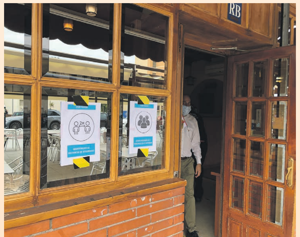
A l'entrada als establiments hi ha gel hidroalcohòlic