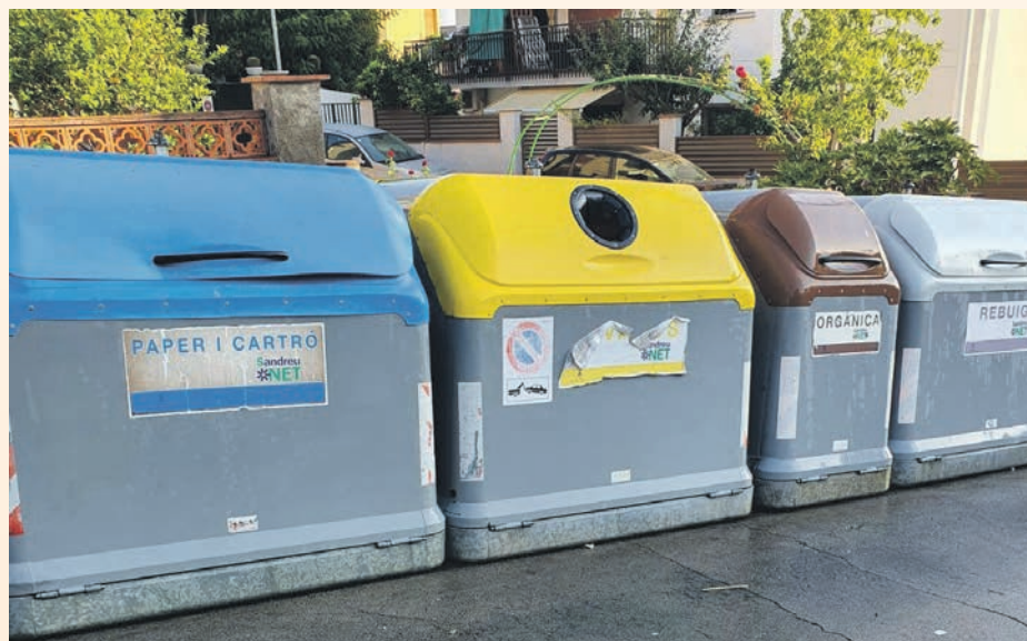
Los contenedores se limpian y desinfectan de manera periódica

actual ha estado activo todos los días. Para residuos especiales y pequeños electrodomésticos los ciudadanos también tienen la opción de dirigirse