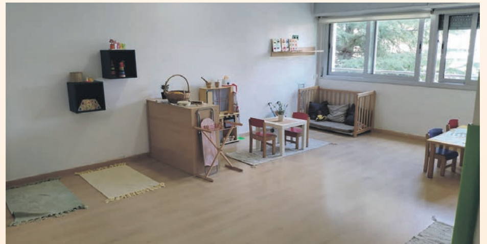
Els centres educatius tindran un professional sanitari de referència

En cas que un infant tingui símptomes, no ha d'anar a l'escola. Tampoc no ho ha de fer si se li ha diagnosticat coronavirus o s'està pendent del resultat d'una prova PCR, ni si conviu amb un cas confirmat. Si hi ha un positiu per covid-19, es posarà el grup de convivència en quarantena. Els aïllaments previstos seran de 14 dies.