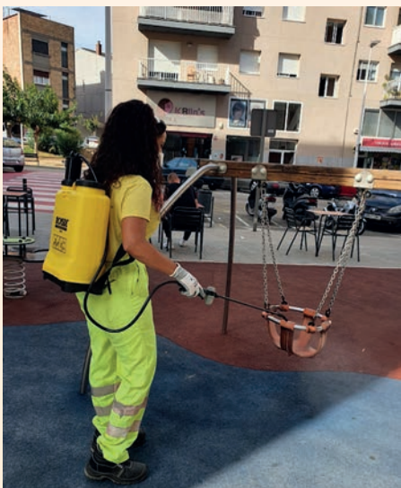
Equipos especiales desinfectan parques infantiles

A raíz de este hecho, el Ayuntamiento ha reforzado el servicio de recogida de muebles y trastos viejos. Durante el año el servicio funciona dos días a la semana, los martes y los jueves, pero dada la situación