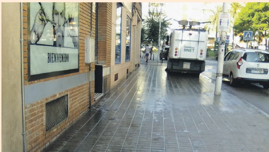
Los servicios de limpieza han intensificado su actuación en zonas conflictivas