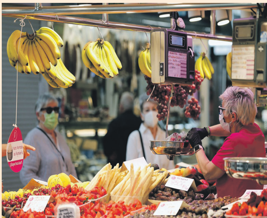
Als comerços també s'ha de respectar la distància social