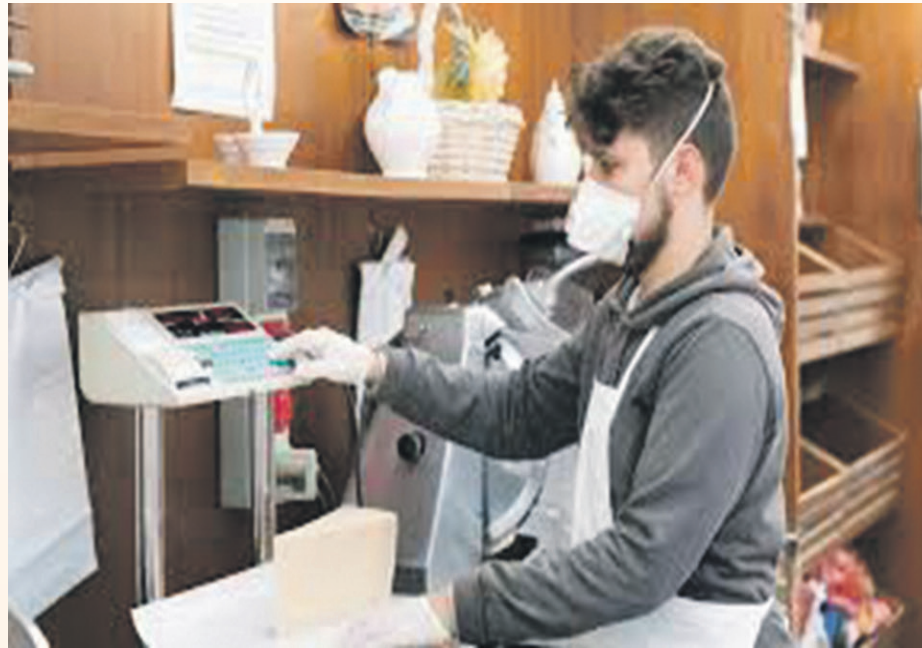
Els comerciants poden demanar ajuts per adequar el lloc de feina

El pla de xoc també preveu un ajut directe de 500 euros amb els que es pretén ajudar als treballadors