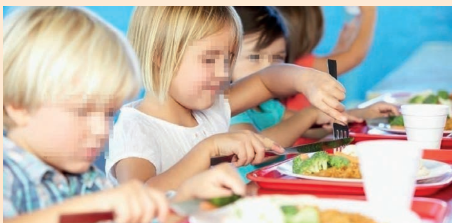
Este mes se abre el plazo para solicitar una beca comedor