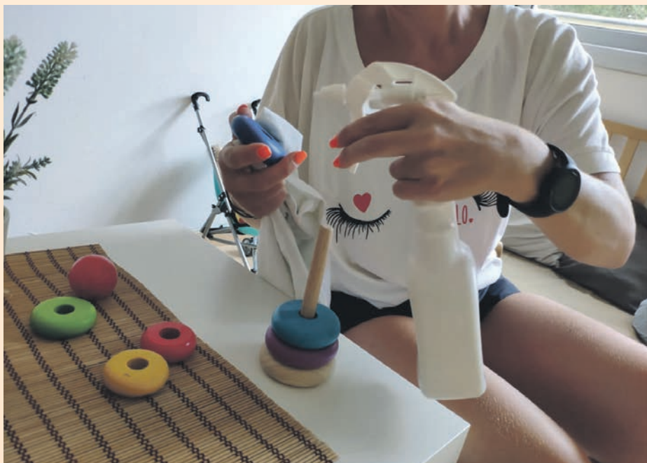
Les escoles bressol han iniciat el curs amb totes les mesures de seguretat

Els infants no han de dur mascareta, ja que el seu ús no està recomanat entre els 0 i els 3 anys. Dins del seu grup estable tampoc cal que mantinguin la distància de seguretat amb els altres infants ni amb la tutora, per a qui tam-