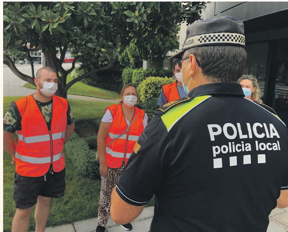
Los agentes cívicos prestan apoyo a la Policía Local

Desde mediados del mes de agosto, un total de 8 agentes cívicos rastrean la ciudad para concienciar a la población de la necesidad de cumplir las medidas de seguridad para evitar rebrotes, controlar aglomeraciones en el espacio público o disuadir la ciudadanía sobre acciones incívicas. Los 8 agentes se dividen en 4 equipos, a cada uno de los cuales se les ha asignado una zona que rastrean en horario de mañana y tarde-noche