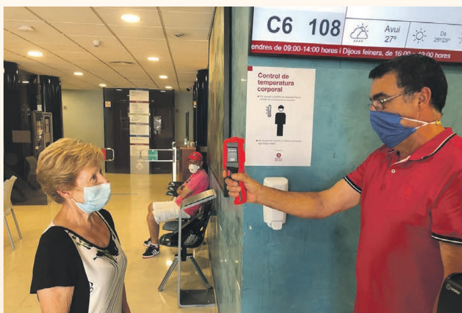
En el acceso al Ayuntamiento se toma la temperatura a los ciudadanos

día para protegernos y proteger a los demás", ha dicho el alcalde.