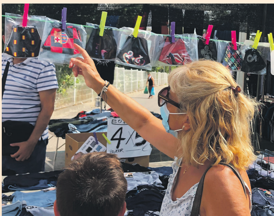
Las paradas del mercado semanal también se han adaptado a la nueva normalidad

Los agentes cívicos han repartido más de 150 mascarillas a personas que no llevaban, han dado más de 700 botes de gel hidroalcohólico y han informado a un millar de personas. Estas mascarillas se suman a las más de 90.000 mascarillas que el Ayuntamiento ha repartido entre colectivos de riesgo, el ambulatorio o las residencias de la ciudad.