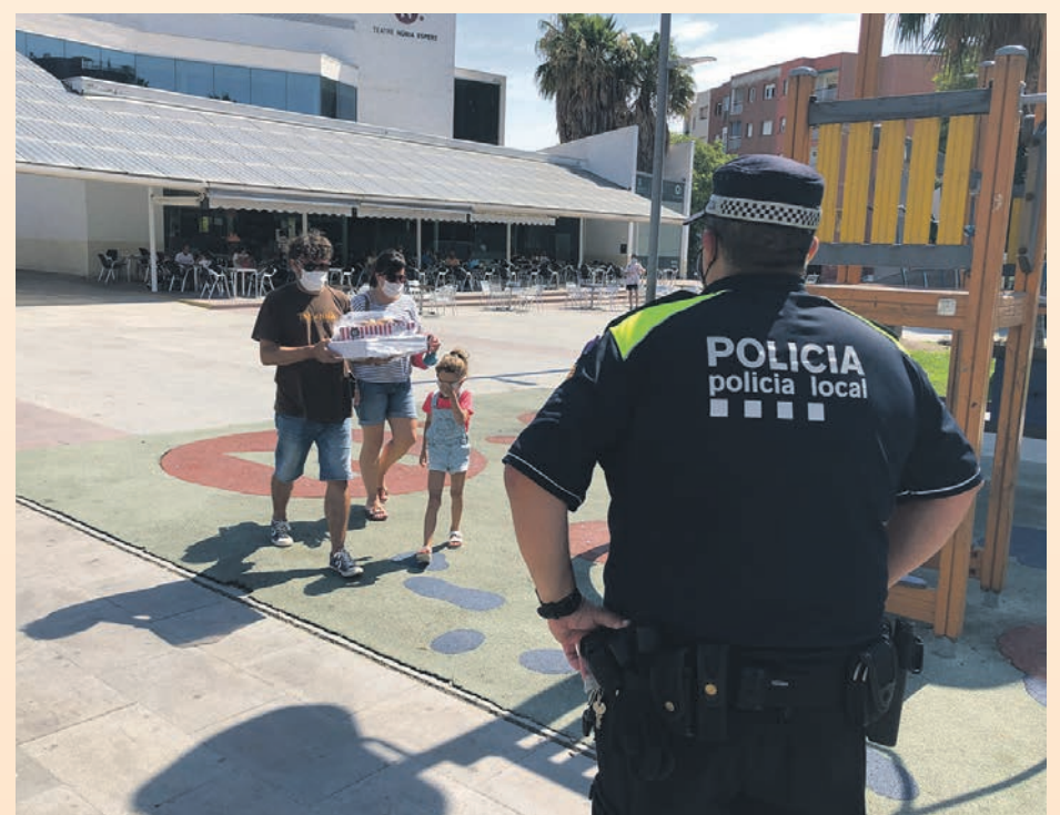
La mayor parte de los ciudadanos son respetuosos con las normas