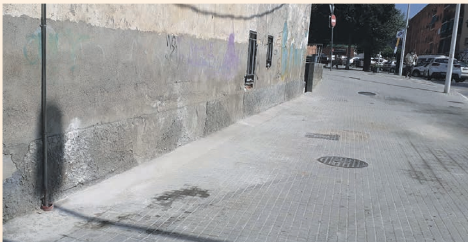
Los vecinos han avisado de acciones incívicas que se han podido subsanar

se han reparado fugas de agua o se han recogido muebles viejos que los propietarios incívicos habían dejado fuera de las áreas destinadas para que se pudieran recoger. Además, los ciudadanos que quieren estar informados puntualmente de la actualidad de la ciudad pueden darse de alta en el servicio de recepción de noticias para lo cual sólo es necesario que envíen un mensaje con la palabra ALTA al 629 70 73 06 haciendo constar su nombre y apellidos.