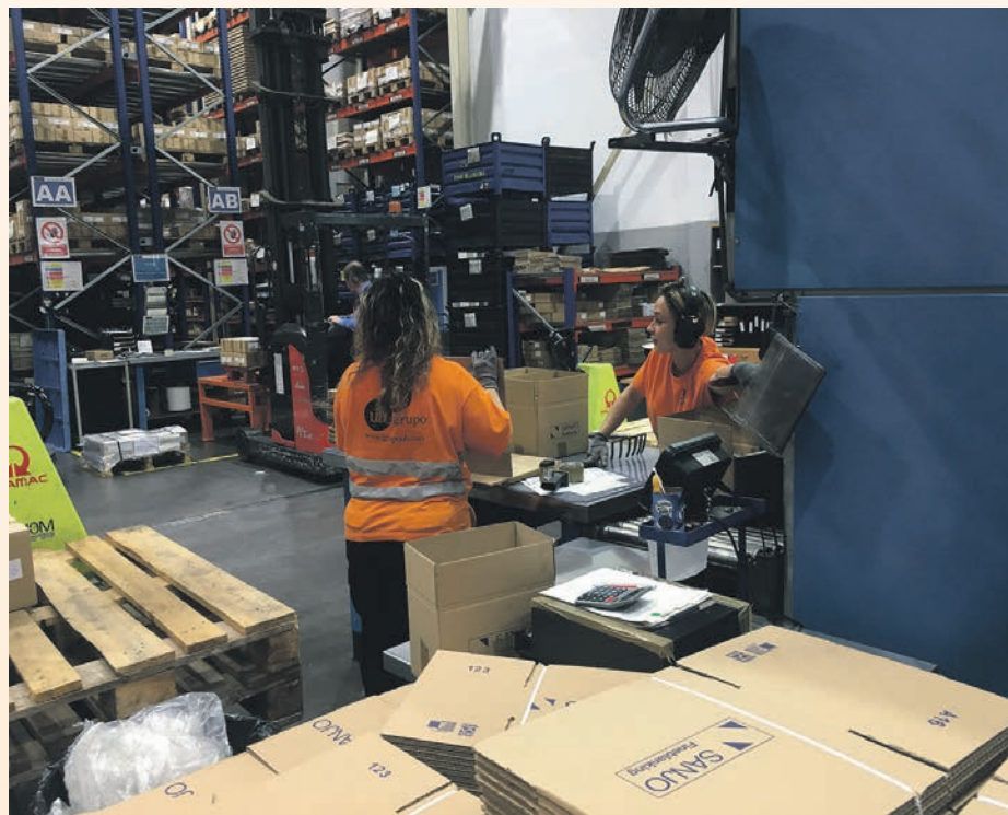
Un dels objectius és el manteniment dels llocs de feina

autònoms a sufragar una part de les despeses que han tingut durant el temps que han hagut de cessar l'activitat, com ara el lloguer dels