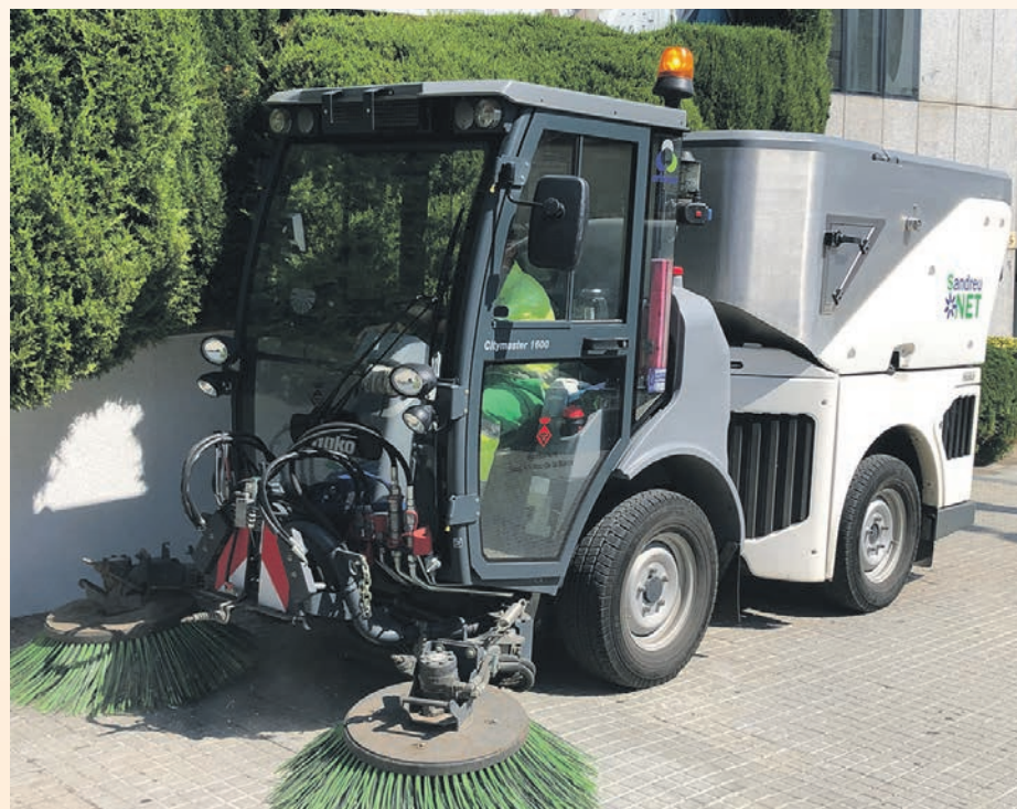
El servei de neteja es manté i s'incrementa per sota del previst

tats per la crisi derivada de la pandèmia, l'Ajuntament ha suspès el cobrament de la taxa per a l'ocupació de la via pública amb taules i cadires. La taxa per la recollida d'escombraries si que pujarà, encara que molt per sota del que marca la plica del contracte amb l'empresa subcontractada. En aquest sentit, l'alcalde ha explicat que "el contracte per a l'adjudicació del servei preveu un increment anual, encara que enguany hem negociat