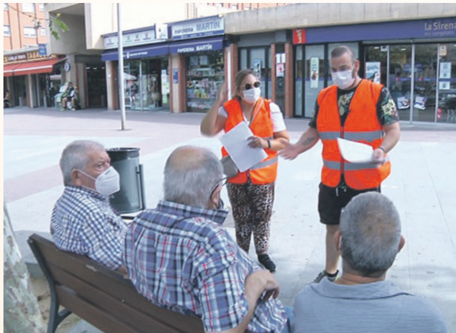
Los agentes cívicos informan de las novedades que hay relacionadas con el coronavirus