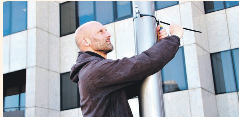
Los captadores se colocaron en 21 puntos diferentes

máforo que hay en la ciudad y que próximamente se suprimirá y se cambiará por una rotonda.