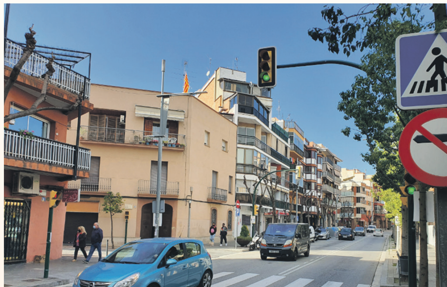
La supresión del último semáforo de la ciudad mejorará la calidad del aire

Uno de los medidores en el que se ha registrado un nivel más elevado de dióxido de nitrógeno, aunque por debajo del máximo recomendado, es el cruce de la calle Major con la carretera de Barcelona. En este punto es en el que hay el último se-