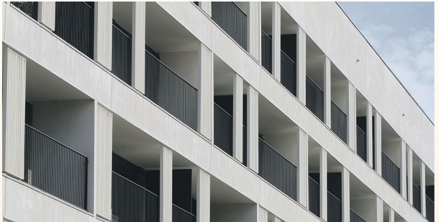
L'IBI es congelarà i no s'apujarà el rebut

borsa d'habitatge de lloguer social. De fet, aquest mes de novembre l'Ajuntament ha incorporat un nou pis a aquesta borsa, que es destina a famílies i persones que pateixen una difícil situació social. D'altra banda, i amb la finalitat d'ajudar a un dels sectors més afec-