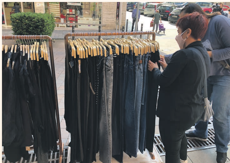
La ayuda llegará a más de 160 comercios

Una vez cerrado el plazo para presentar la instancia, el Ayuntamiento comprobará los datos adjuntados a la instancia e ingresará los 500 euros.