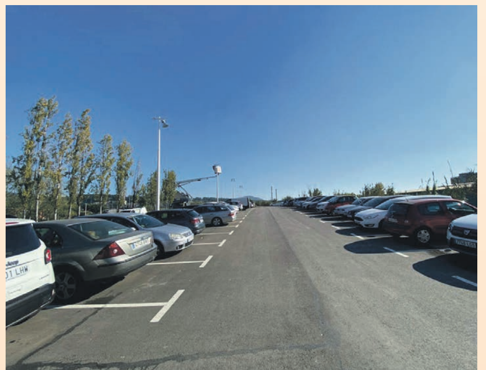
L'aparcament doblarà la seva capacitat

L'alcalde ha explicat que "l'ampliació facilitarà l'aparcament a aquesta zona de la ciutat, que ja ha millorat arran de la posada en funcionament, fa gairebé un any, d'aquesta primera fase".