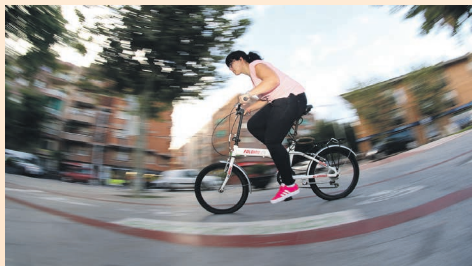
L'estudi determinarà la demanda que hi ha a la ciutat

La Generalitat, l'Àrea Metropolitana de Barcelona (AMB) i el Consell Comarcal seran les administracions encarregades de dur a terme l'estudi, una iniciativa que s'ha presentat al consell d'alcaldes del Baix Llobre-