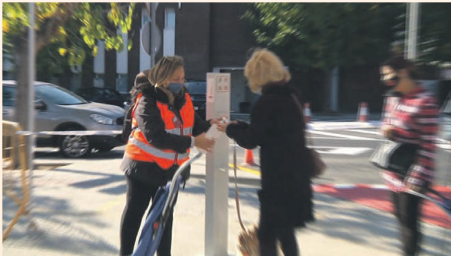
Reparten gel hidroalcohólico a las personas que acceden al mercado

Los agentes cívicos forman parte de un plan de ocupación que facilita la integración laboral de estas personas.