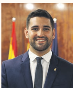
Xavier Pla Ciutadans