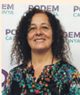
Isabel Marcos Podemos