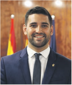
Xavier Pla Ciutadans