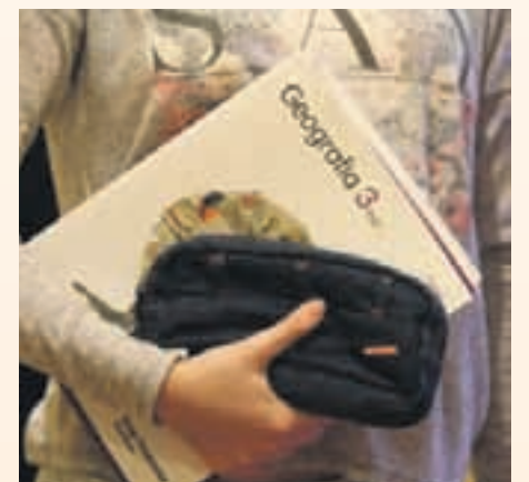
Cada alumno puede recibir un máximo de 75 euros

La finalidad de este tipo de ayudas es prevenir situaciones de riesgo y facilitar la integración y el adecuado desarrollo de los niños de la localidad en el ámbito escolar. Cada alumno se podrá beneficiar de una ayuda máxima de 75 euros.