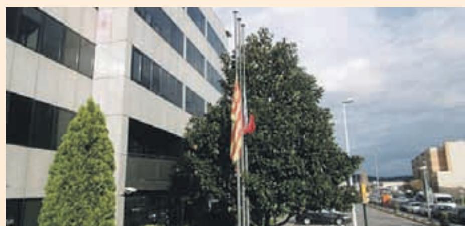
Les banderes van onejar a mig pal en memòria de les víctimes