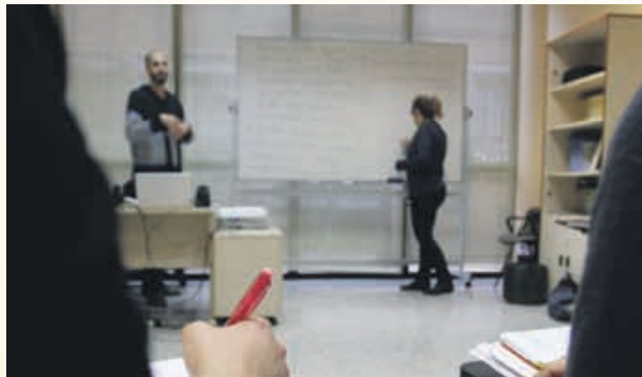
Este tipo de cursos pretende que los jóvenes recuperen la motivación por los estudios

La inscripción para asistir a este curso está abierta y se puede hacer en las dependencias municipales de las Escoles Velles de lunes a viernes en horario de atención al público.