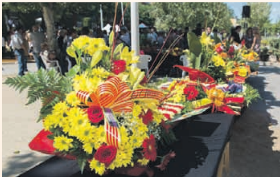
Entitats i partits polítics participen de l'ofrena floral a la plaça Onze de Setembre