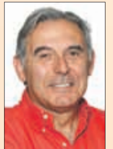
M. Enric Llorca i Ibáñez Alcalde de Sant Andreu de la Barca

El consistorio da respuesta de esta manera a la promesa de no dejar solos a los ciudadanos en los peores momentos. No podemos ser insensibles al sufrimiento de nuestros vecinos, con independencia quién o qué haya provocado el mal. Lo hemos hecho en otras ocasiones, como por ejemplo con los problemas derivados de la crisis económica poniendo en marcha acciones para paliar sus efectos, y lo volvemos a hacer ahora. No os dejaremos solos y pedimos vuestra colaboración para poder dar respuesta a las dificultades que nos podamos encontrar en el camino y para diseñar el futuro de la ciudad. El Ayuntamiento también ha actuado de manera urgente iniciando unas obras de mejora que contribuyan a incrementar la capacidad de drenaje de las calles más afectadas, que confiamos que den resultado cuando se produzcan lluvias moderadas o fuertes. En caso de lluvias torrenciales como las de este mes de agosto os pedimos que extreméis las precauciones, que no os pongáis en riesgo y que sigáis siempre los consejos e indicaciones de los cuerpos de seguridad.