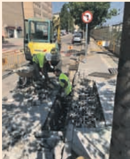
Los trabajos más urgentes han comenzado en la calle Anoia

que se pueden dirigir en horario de mañana (de 9h a 14h) en la quinta planta del Ayuntamiento.