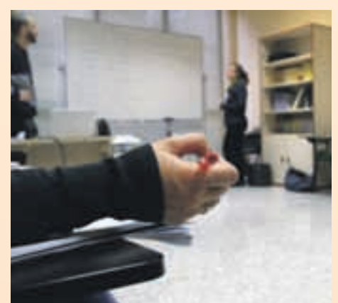
Les classes es fan a les dependències d'Escoles Velles

En cas de necessitar alguna informació addicional us podeu posar en contacte amb el Servei de Català de Sant Andreu de la Barca al número de telèfon 93 682 52 88 o al correu electrònic santandreubarca@cpnl.cat.