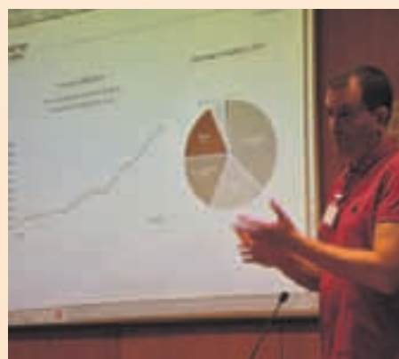
Imagen de una edición anterior del programa

El programa está pensado para empresas con la voluntad de invertir en