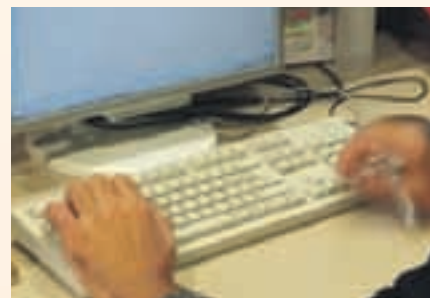
La iniciativa se dirige a diversos perfiles profesionales