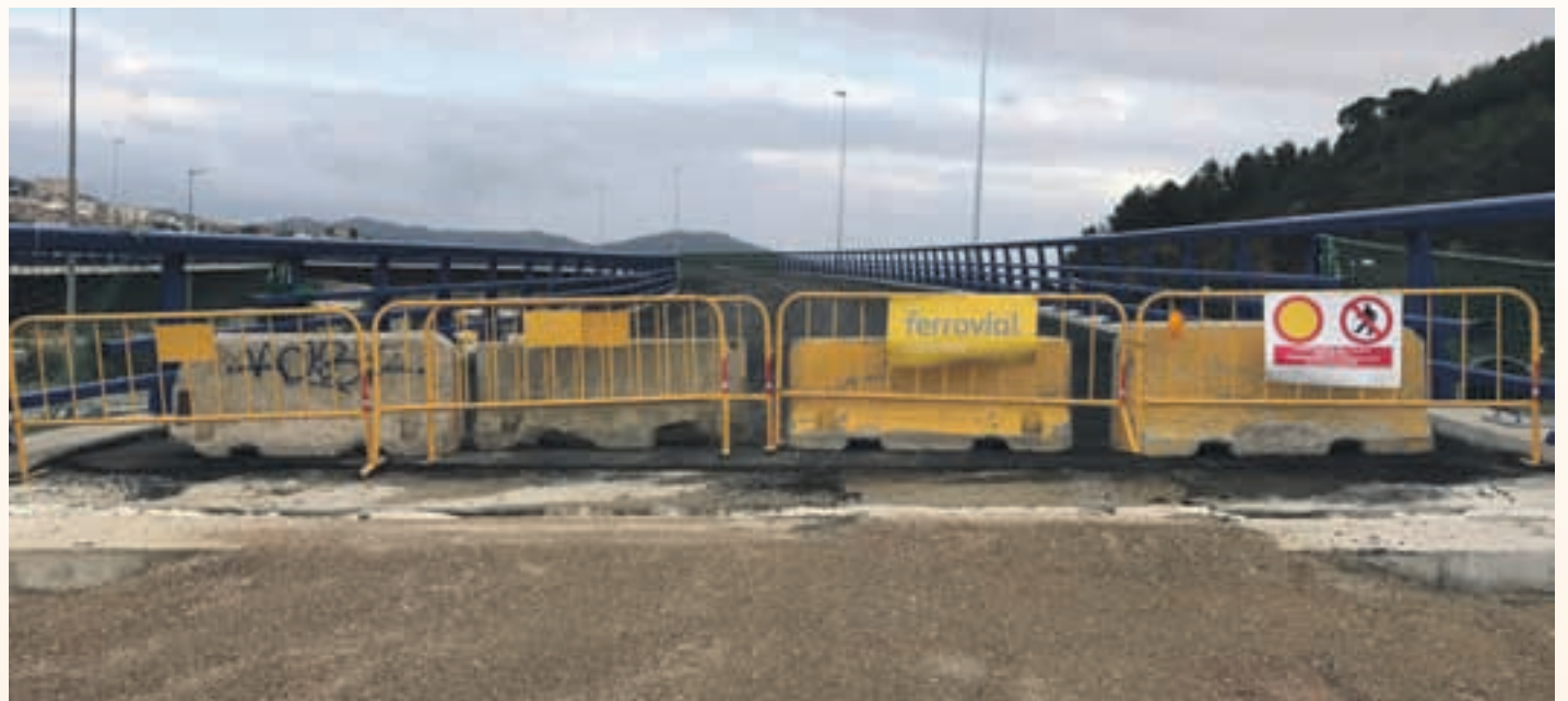
Les obres es van aturar fa mesos i són fonamentals pel desenvolupament de la zona i del país

L'alcalde ha explicat que "la delegada ha expressat la seva voluntat de diàleg, el seu compromís amb que es reprenquin