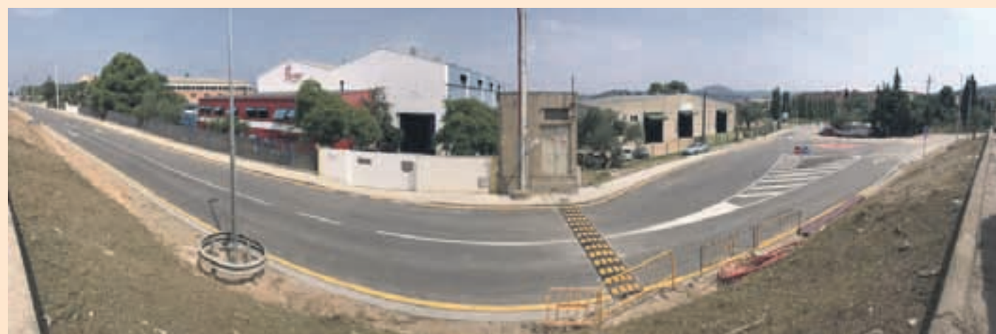
Els treballs faciliten l'accés a la deixalleria i milloren la competitivitat de les empreses

Les obres han consistit, entre d'altres coses, en la renovació de l'asfalt i el paviment, facilitant d'aquesta manera l'accés a la deixalleria. L'alcalde ha assegurat que el projecte de remodelació de la zona industrial "incrementarà la competitivitat de les empreses que hi estan implantades, que augmentaran la seva capacitat de treball".