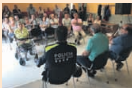
Imagen de la reunión del alcalde en la sede de la AVV de La Plana

Desde el momento en el que se empezaron a registrar los primeros problemas se constituyó un gabinete de crisis para gestionar la situación, que ha estado permanentemente en alerta. Inicialmente, el Ayuntamiento habilitó un punto de información a los afectados, que atendía el responsable de la Policía Local, que asesoraba a los implicados en los pasos que debían seguir con sus compañías de seguros. Esta atención ahora se traslada a la Oficina de Aten-