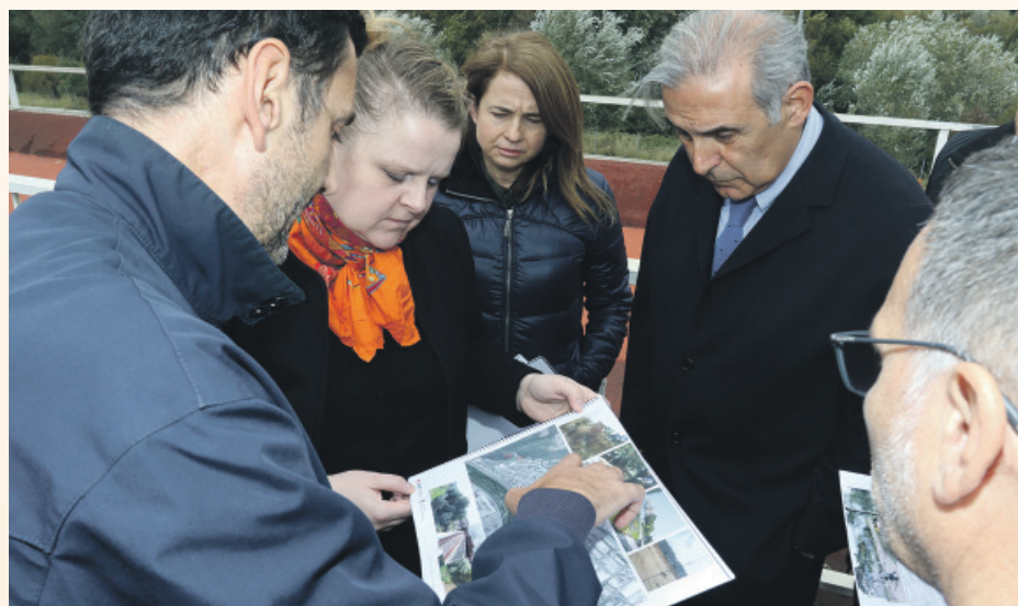
La Organización Mundial de la Salud se ha interesado por el proyecto

El proyecto prevé la mejora de los accesos, la instalación de más luz, la limpieza de la zona y la adecuación de los caminos