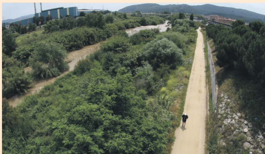
Las obras permitirán recuperar un espacio para el disfrute de los ciudadanos