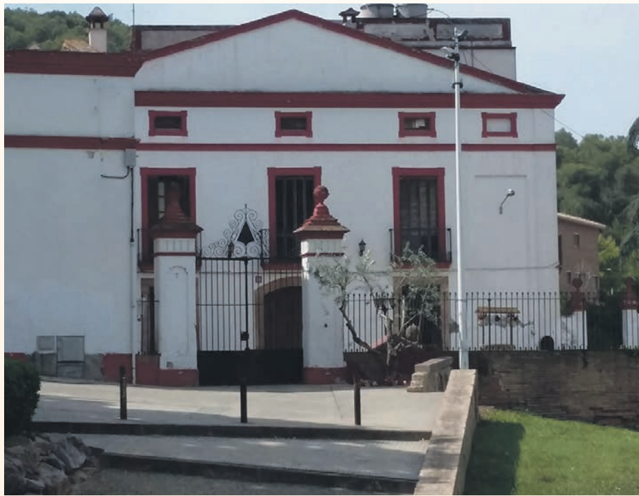
La masia de Can Sunyer serà la seu d'aquesta nova iniciativa

El projecte, que es marca com a finalitat promoure la creació de cooperatives agrícoles per a fomentar l'ocupació, es duia a terme fins ara als horts municipals de la zona de Can Salvi.