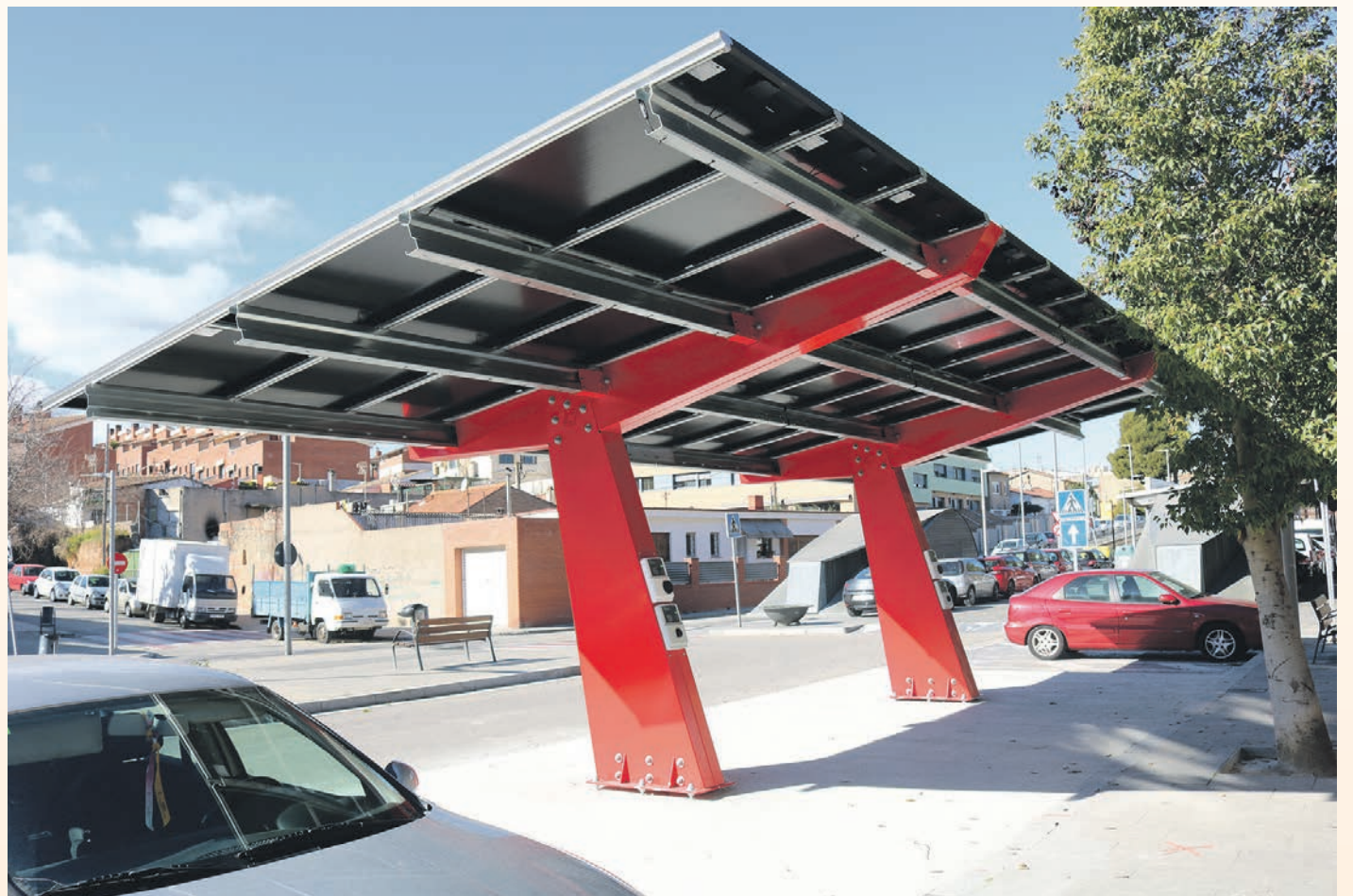
La fotolinera s'ha instal·lat a prop de l'estació de Ferrocarrils

La fotolinera permet transitar dels combustibles fòssils cap a les energies renovables, a partir de l'ús d'uns