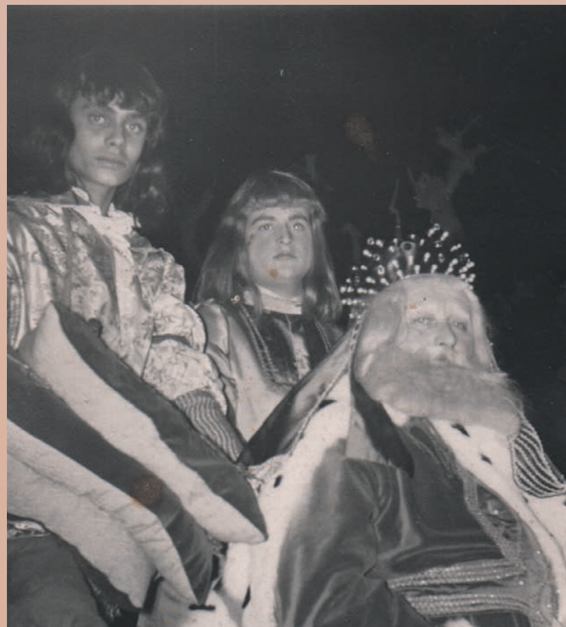
Fotografia realitzada durant la cavalcada dels Reis Mags a Sant Andreu de la Barca. Data atribuïda entre l'any 1970 i 1971.