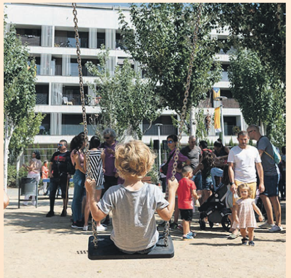
Les activitats es fan a l'aire lliure i després de classe

Les activitats es faran als jardins de Montserrat Roig, a la plaça Onze de Setembre i a la plaça de Mercè Rodoreda.