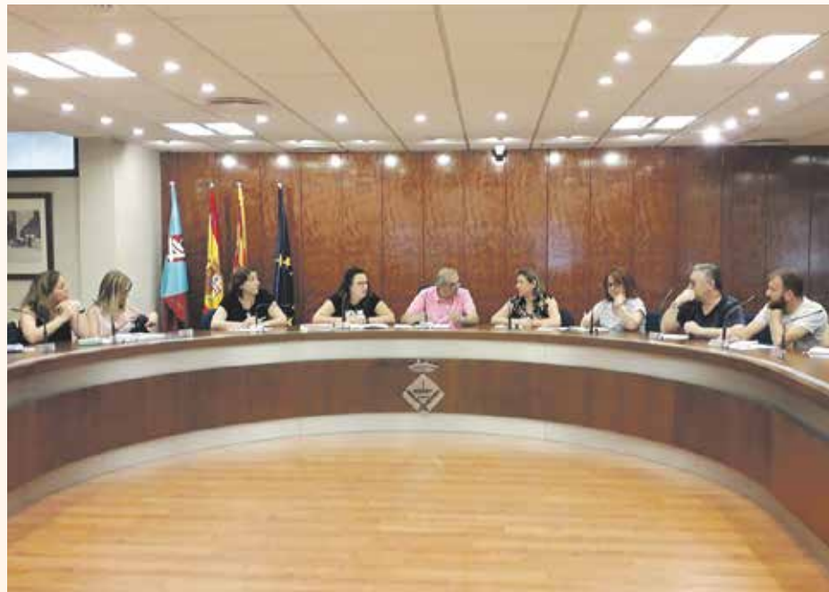
El Consell Escolar Municipal ha rebutjat la decisió de la Generalitat

Segons la resolució del Consell Escolar Municipal "el descens de la demografia ha de veure's com una oportunitat per mantenir les matei-