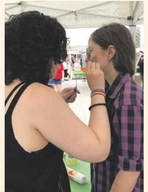
Los más pequeños pudieron participar en talleres