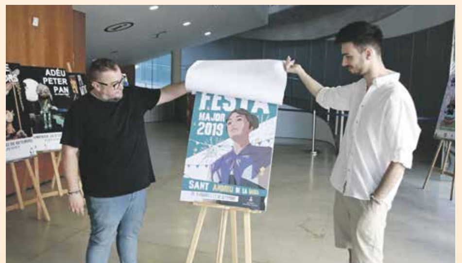
El regidor de Cultura i el dissenyador han presentat el cartell d'enguany

El guanyador del concurs, a més de veure la seva obra anunciant l'esdeveniment a tota la ciutat, ha aconseguit 350 euros.