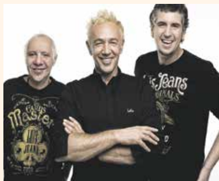
El grup La Unión posarà música a la Festa Major

La Festa de l'Aigua, la Barca del Senyor Andreu o la gimcana nocturna, l'activitat amb més seguidors de la Festa Major i que enguany té com a tema la conquesta de l'espai, ocupen també un espai rellevant a la programació festiva de Sant Andreu de la Barca.