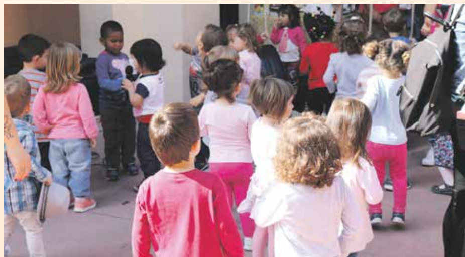
Les places d'escola bressol públiques s'ampliaran el curs vinent

El pròxim curs escolar la Casa Estrada tornarà a acollir aules d'escola bressol després de la decisió de l'Ajuntament d'habilitar una part d'aquest edifici amb un servei d'aquestes característiques. D'aquesta manera, el consistori garanteix a les famílies de la ciutat l'accés a una plaça d'escola bressol. El tancament de Nostra Senyora del Carme, el centre concertat que ha funcionat a la ciutat durant dècades, feia que moltes famílies de Sant Andreu es quedessin sense plaça d'escola bressol. Davant d'aquesta situació, i amb la finalitat de donar resposta a la demanda dels ciutadans, el consistori ha optat habilitar una part de l'edifici modernista per acollir una escola bressol. Fins ara a Sant Andreu de la Barca hi havia tres escoles bressol municipals, amb un total de 230 pla-