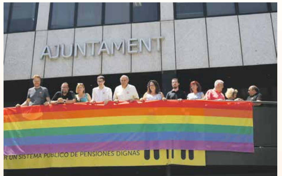
El consistorio se ha vuelto a sumar a los actos de apoyo al colectivo

Coincidiendo con la conmemoración del Día Internacional del Orgullo LGTBI, el edificio del ayuntamiento ha lucido la bandera del arco iris.