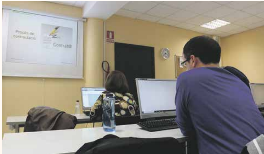
L'objectiu de la iniciativa és donar suport als emprenedors

El concurs, que té cinc categories, busca també augmentar la projecció externa dels serveis