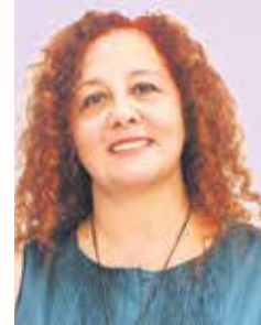
Isabel Marcos Podemos