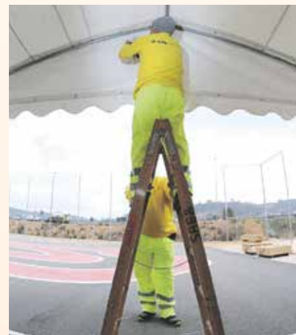
donant els seus fruits reduint el nombre d'aturats.

El nombre d'aturats a Sant Andreu de la Barca es situa en 1.333 persones. Actuacions com ara l'ajut a les empreses, la subvenció de nous treballadors, la posada en marxa de plans d'ocupació o les polítiques de suport als emprenedors segueixen