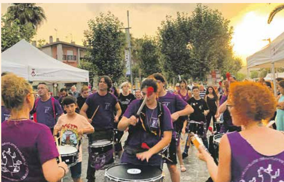
Las actividades se sucedieron durante toda la tarde