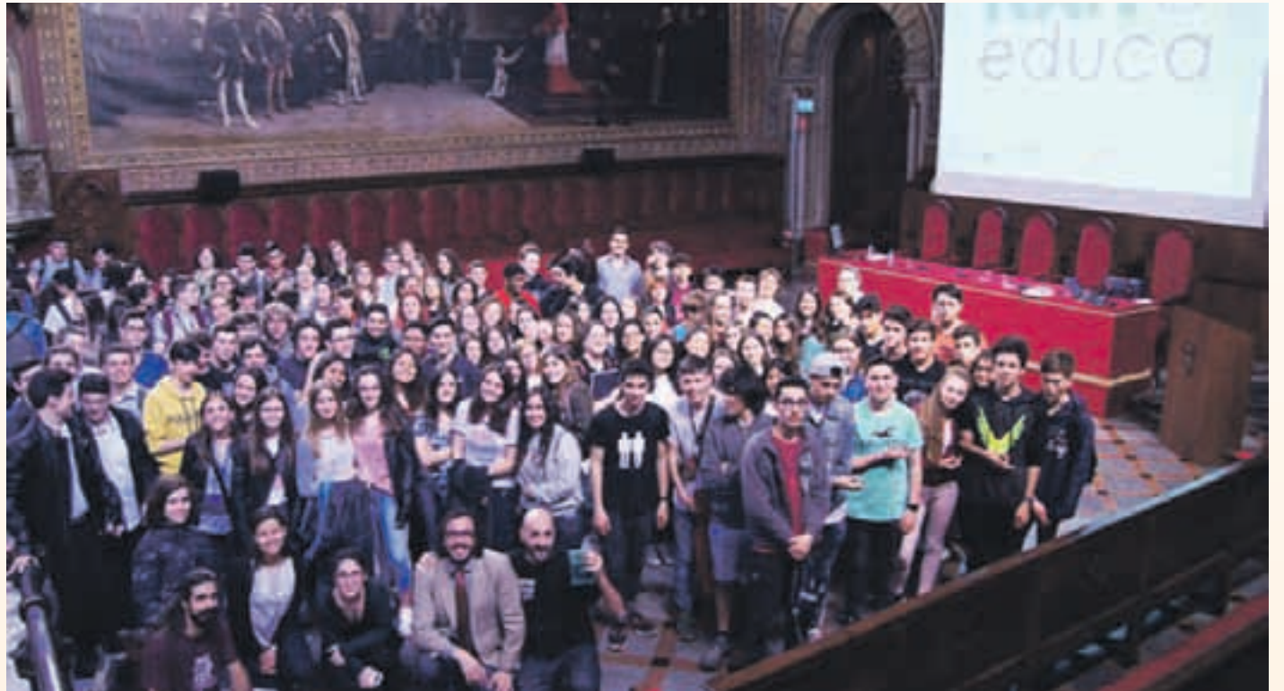
Al programa han participat alumnes de tot Catalunya

La proposta pretén introduir l'alumnat i el professorat d'ensenyament secundari en els conceptes bàsics de la nanotecnologia; millorar la capacitat professional i actualitzar coneixements dels docents de secundària i la seva formació permanent; fomentar l'interès i crear vocacions dels alumnes per les disciplines científicotècniques; fer palès al conjunt de la comunitat educativa la presència cada vegada més habitual de productes amb components nanotecnològics en la vida quotidiana; conscienciar sobre la importància de les nanotecnologies i del fet que ja es puguin