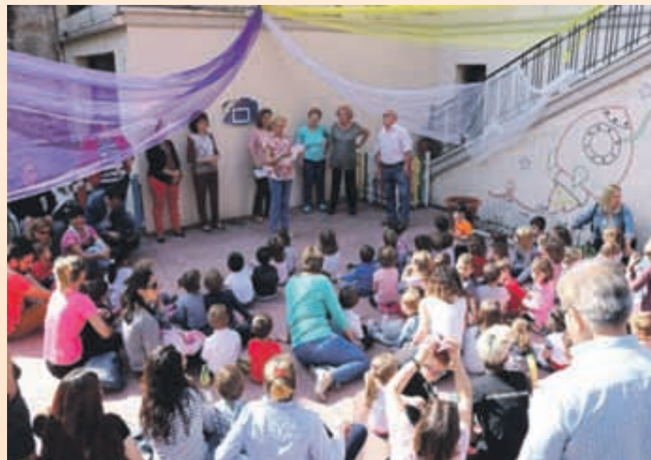
Las personas mayores hacen actividades para los más pequeños

El alcalde de Sant Andreu de la Barca, Enric Llorca, ha explicado que "el objetivo es que los niños y los mayores se puedan relacionar y aprendan los unos de los otros". Durante estos encuentros, por ejemplo, los mayores organizan bailes y obras de teatro adaptadas a la edad de sus espectadores.