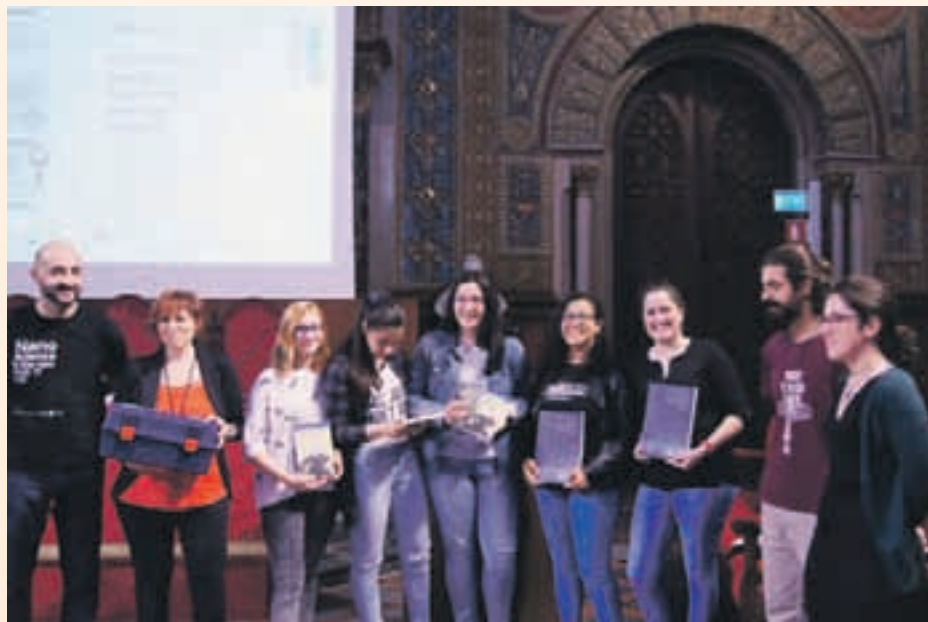
Els estudiants de l'IES Sant Andreu van recollir el premi

considerar com a tecnologies d'interès general; i crear una xarxa d'intercanvi de coneixement i col·laboració permanent entre professionals investigadors i docents en actiu.