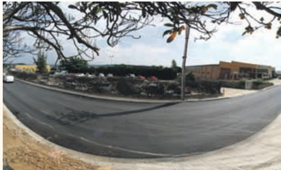
Les obres acabaran a principis del mes vinent

coses, en la renovació de l'asfalt i el paviment, facilitant d'aquesta manera l'accés a la deixalleria.