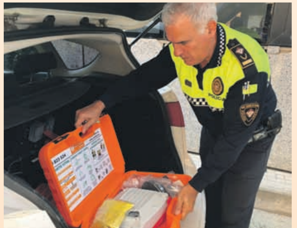
Tots els vehicles policials incorporen un desfibril·lador

L'Ajuntament també disposa de desfibril·ladors a les instal·lacions esportives municipals, a la comissaria de Policia Local i al Teatre Núria Espert.