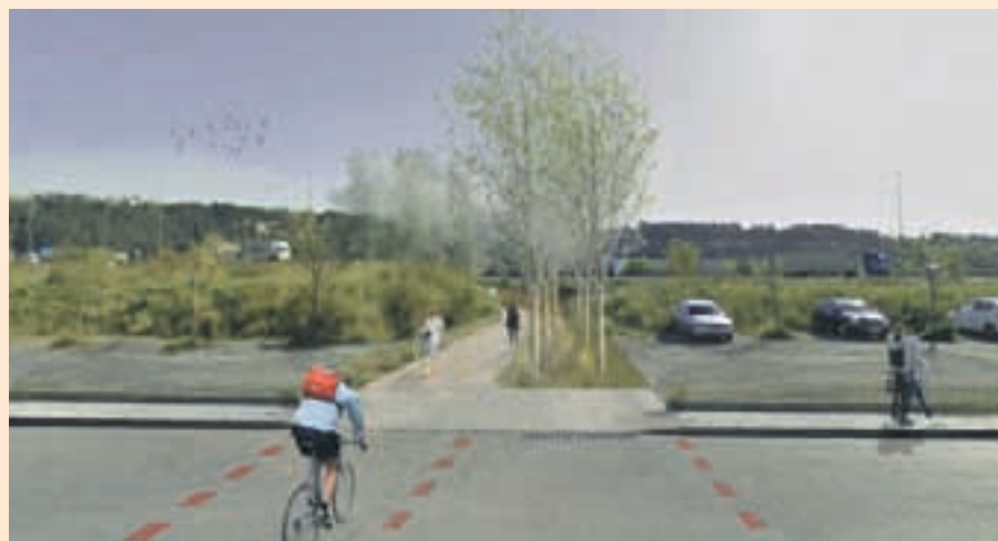
Imagen virtual de cómo quedará el acceso al río

La recuperación de la ladera del Llobregat puede contribuir a incrementar la actividad física entre los ciudadanos, que dispondrán de un nuevo espacio de ocio, que vendrían