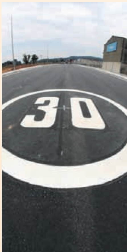
Les obres acabaran a principis del mes vinent

L'actuació també beneficiarà als usuaris de la popular zona de pic-nic. "Els caps de setmana aquesta zona té una gran afluència de públic i amb la construcció d'aquest carrer millorem la circulació i ampliem l'espai per es-