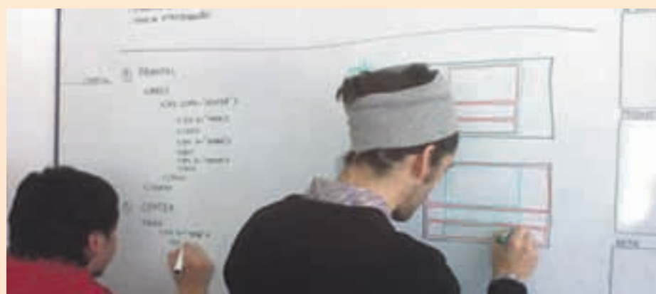
Desenes d'estudiants fan servir les aules d'estudi per preparar els seus exàmens

El regidor de Cultura i Joventut de l'Ajuntament de Sant Andreu de la