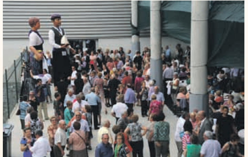
Un millar de personas participan en el homenaje a las personas mayores