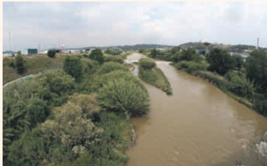
Un estudio analizará los beneficios para la salud del proyecto

La concejal de Urbanismo, Eva Prim, ha explicado que la actuación también prevé la mejora de los tres accesos para llegar hasta el río con la instalación de más luminosidad y la limpieza de la zona y se mejorarán los caminos.