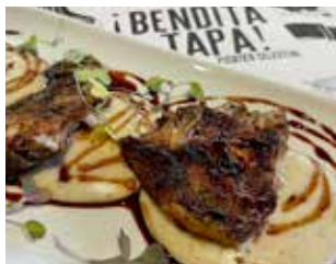
BENDITA TAPA Ctra. de Martorell, 3 Barri: Centre MELÓS DE SECRET DE PORC AMB PARMENTIER DE TÓFONA I REDUCCIÓ DE MONTSANT + BEGUDA