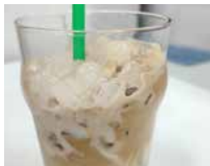
LA JIJONENÇA Av. Constitució, 4 Barri: Centre FRAPPÉ PARTY