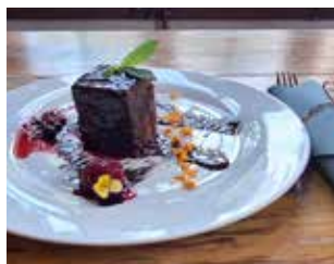
EL CAFÈ DEL CASINO C. de Catalunya, 2 Barri: Nucli Antic TARTA SACHER AMB MELMELADA ARTESANA DE FRUITS VERMELLS + BEGUDA A ESCOLLIR