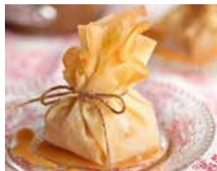
BAR TRAGA TRAGA Av. de Guatemala, 8 Barri: La Solana FARCELLETS DE "TRAMPANTOJO" DEL TERRENY + BEGUDA