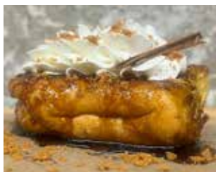
DGUSTAM C. Bonaventura Pedemonte, s/n Barri: Can Prats "LA TORRIJA" DEL DIVENDRES NIT + CAFÈS I/O XARRUP