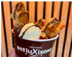
GELATERIA MYKONO Av. Constitució, 60 Barri: Centre MYKONOS: TIRES DE GOFRE BELGA AMB NUTELLA ACOMPANYAT D'UNA BOLA DE GELAT DE VAINILLA + AIGUA O CACAOLAT)