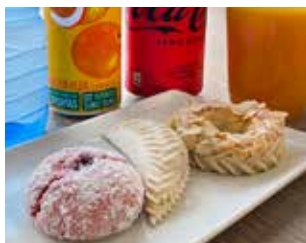
CAL FORNER & VENETZIA Av. de Guatemala, 35 Barri: La Solana PASTES D'AMETLLES I CACAUETS + BEGUDA