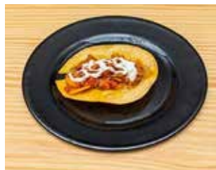
CREPERIA ESSÈNCIA Av. Constitució, 9 Barri: Centre MELÓS DE VEDELLA I CREMÓS DE FORMATGE + REFRESC, CERVERSA, CLARA O AIGUA