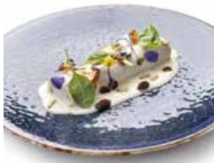
CÓRDOBA C. de la Creu, 17 Barri: La Solana CANELÓ DE SECRET IBÈRIC AMB BEIXAMEL TRUFADA + BEGUDA