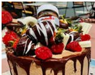
PASTISSERIA ARENAS C. de Sant Jordi, 3 Barri: La Solana PORCIÓ DE PASTÍS + XOPET