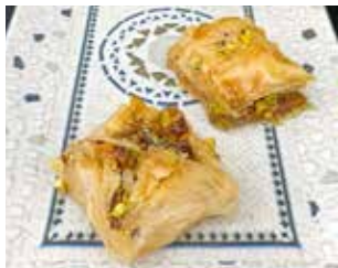
SNACK TUBI C. Vall del Palau, 8 local 3 Barri: El Palau DOLÇ ARÀBIC + TE ARÀBIC