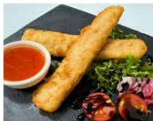
BAR MORA C. Parc Vall Palau, 4 local 5 Barri: El Palau FINGERS DE PEIX AMB SALSAS XILI + BEGUDA