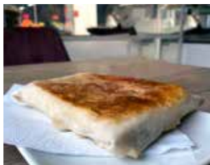
CAL FORNER & VENETZIA Av. de Guatemala, 35 Barri: La Solana EMPANADA DE POLLASTRE O PEIX + BEGUDA