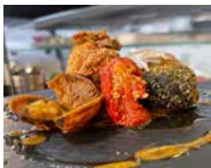
BAR ACUARIUM C. Parc Vall Palau, 4 local 3 Barri: El Palau DAUS DE CARN DOS SABORS AMB SALSAS MAR I MUNTANYA + BEGUDA