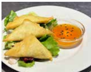
BAR PALAU C. Parc Vall Palau, 6 local 1 Barri: El Palau EL TRIANGLE + BEGUDA