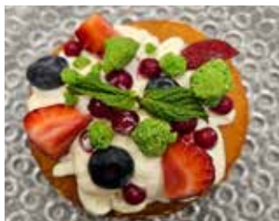
EL PALAU VELL RESTAURANT Camí Vell del Palau, 6 Barri: El Palau PANCAKES AMB CREMA DE MASCARPONE, FRUITS VERMELLS I CRUMBLE PISTATXO + BEGUDA