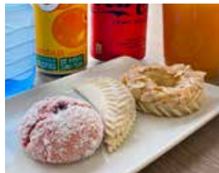
VENETZIA PASTISSERIA Pl. Catalunya, local 10 Barri: Nucli Antic PASTES D'AMETLLES I CACAUETS + BEGUDA