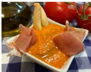
BAR RESTAURANT "PLATILLOS" Ctra. de Barcelona, 3 Barri: La Solana PORRA ANTEQUERANA + BEGUDA